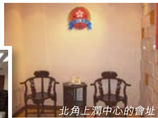
北角上潤中心的會址