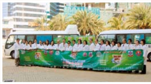
中醫流動車義診服務—本會多名醫師參與社區中醫義診服務，為長者提供中醫藥治療及健康講座

由國家中醫藥管理局主辦為期3年的中醫中藥中國行，香港站活動由特區政府衛生署協辦，舉辦全港十八區中醫診所義診日，本會與香港博愛醫院合辦「中國中醫中藥行義診流動車服務」