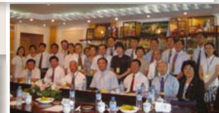
香港註冊中醫學會代表團於2007年7月23日拜訪國家中醫藥管理局，與領導合照。