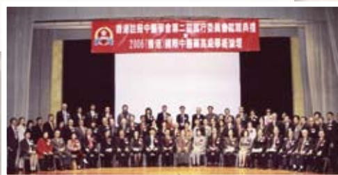
香港註冊中醫學會舉行第二屆執行委員會會就職典禮暨2006(香港)國際中醫藥高級學術論壇

2006.3 開展服務社區活動 定期在九龍深水埗李鄭屋居民協會舉辦中醫義診服務，贈醫施藥，並舉辦健康講座，深受基層市民歡迎。