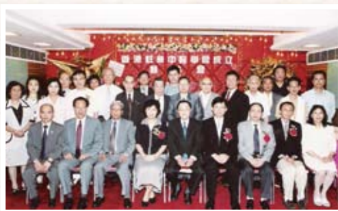
香港註冊中醫學會於2003年成立並舉行新聞發布會，與會嘉賓衛生署及中聯辦代表與創會成員合照